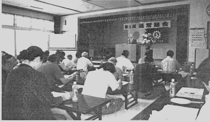
特手会長のあいさつ

鶴の町商工会第五回通常総会が、五月二十三日(日)午後三時より、高尾野老人福祉センターで開催され、特手会長挨拶のあと、今まで功績のあった方々の表彰を行いました。本年度は、各事業所から推薦のあった四名の方々が優良従業員として表彰され、賞状と記念品が特手会長より手渡されました。