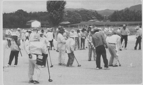
【最後だよ、よくならって!】