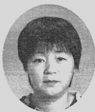
女性部 部長 女 性 部 長 軸 菌 早 苗