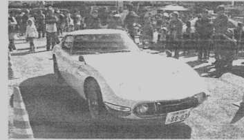
▲当時の最新技術が詰めこまれた希少なスポーツカー 2000GT