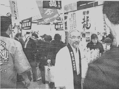
▲鹿児島からのブースもがんばっています

今年度、役員を中心に、商工会事業や業種別部会活動を強化していく事を確認し、次年度へ向けて円滑な運営を図るべく、取り組みを開始しました。