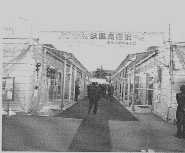
▲プレハブの建物の中で頑張っています

陰様で私の自宅の家屋は、高台の方にあつたので、何とか地震では持ちこたえました。しかし残念ながら、その後の津波と火災で商店街や街のほとんどがご覧の通り全滅しました。さらに、その後の「被災地荒らしの泥棒」が暗躍し、心が痛みました。この被害はこの町のみならず他の町でも同様だったようです。表面には出ないこの盗難による被害も結構な金額になるのではと思います。」と話されました。「地震・雷・家事・おやじ」と言いますが、ここでは「地震・津波・火事・泥棒」と言うべき、とても治安も悪い状況下に一時はなつていたという事です。