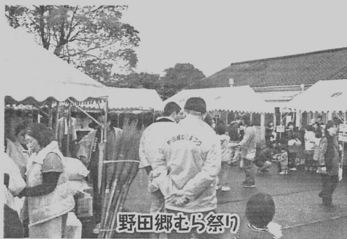
野田郷むらまつり

十二月一日、野田農産加工施設と周辺施設で、野田地域内で生産された新鮮な農産物と農産加工品が一堂に揃い展示即売される歳の市「野田郷むらまつり」が開催されました。