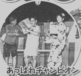
あっぱれチャンピオン