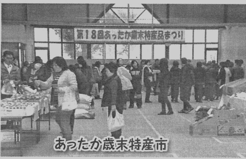
あったか歳末特産市

本市の特産品・正月用品の即売等があり家族連れのお客の市民の方が訪れ、抽選会などもあり賑わっていました。