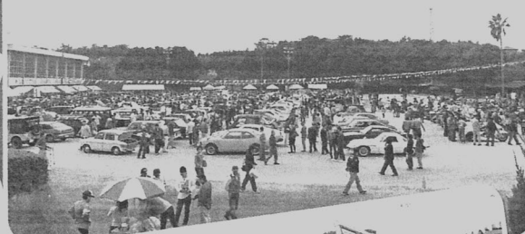
会場いっぱいのオールドカー

最後に、準備から当日のスタッフ、そして後片付けまでお手伝い頂いた皆様方やご協賛やご寄付をいただいた方々に心から厚く御礼申し上げます。