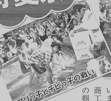
わっしょい わっしょい